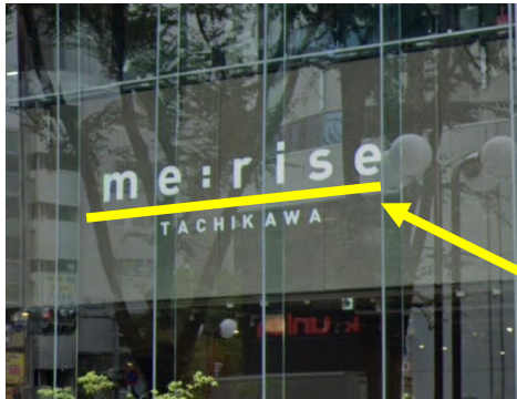
岩崎共同ビルディング