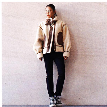
☑ 黒スキニーをメンズライクな着こなしで 「「6(roku)」のボアアウターはちょっぴり無骨なオーバーサイズ感が気に入って。切りっぱなしのすそがポイントの「jonnlynx」のスキニーを合わせ、メリハリシルエットを意識」