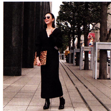
☑ 黒ニットワンピースは脇腹の肌見せがキモ！ 「「TAN」のワンピースはゆるっと余裕のあるシルエットで着ていて楽ちん。なんだけど、脇腹だけちょこっと開いているんです。ボディラインが意識できる「黒」アイテムが好み」