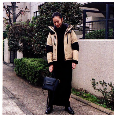
☑ 黒ベースで楽しむ都会派アスレジャー！ 「「ザ・ノース・フェイス」のダウンに、「ドゥーズィエム クラス」のニットワンピース。ゆるめのアイテム合わせなので、「セリーヌ」のバッグできちんと感をトッピングしました」