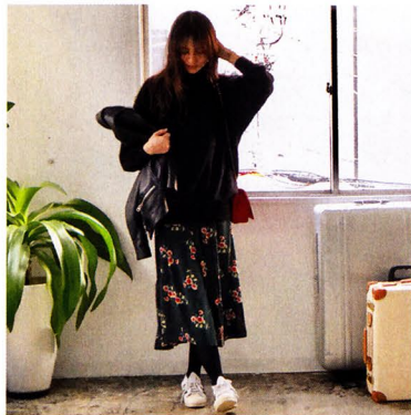
☑ 着慣れない甘めのアイテムも黒なら自分らしい 「「BABYLONE」の花柄ワンピースの上に、「バレンシアガ」のニットを重ねて。小口柄が甘くなりすぎないよう、足元は「Adidas」のスニーカーでハズしました」