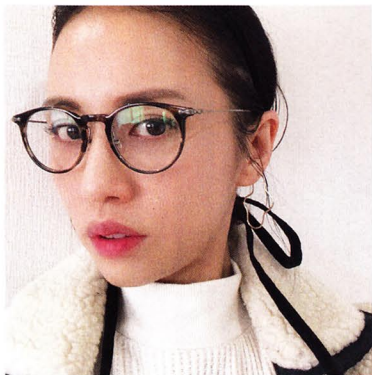
☑ ダメメガネは大きめのフレームが好き♡ 「顔周りが寂しいなときや、メイクが薄めるとき(笑)に役立つメガネ。これは「Oliver Peoples」のもの。クラシカルな丸いフレームと華奢なテンプルが気に入ってます」

「黒は*ドキッ、とする要素と一緒に、セクシーに着たい！ 肌見せの多いものやエッジの立ったデザインが多めです」